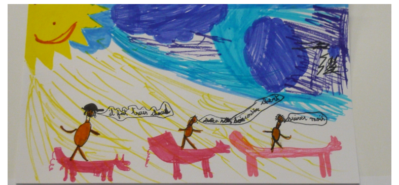
Mon skate-cochon porte beaucoup de messieurs, c'est pour ça qu'il est fatigué. Victor